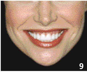
9. Lèvre supérieure courte.