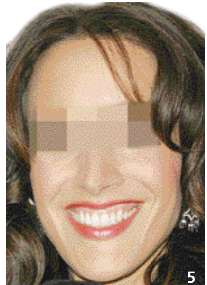
5. Exemple de visage long.

tion idéale, laisse apparaître toutes les surfaces dentaires maxillaires ainsi que les papilles gingivales Paris et Faucher (11). Borghetti (1) admet jusqu'à 1 mm de gencive apparente au-dessus de la JEC. Cette catégorie de patients représente 70 % de la population.