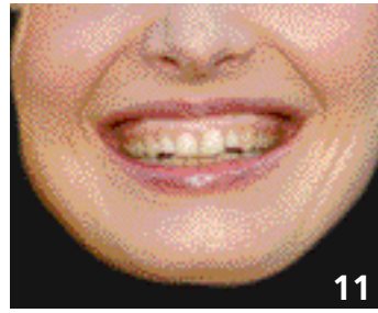
11. Dents petites.