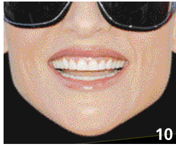
10. Dents écourtées par usure.