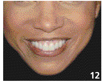
12. Discordance des plans occlusaux.