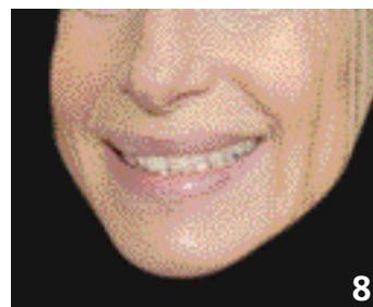
Positions du sourire : 6. moyenne 7. gingival 8. basse.